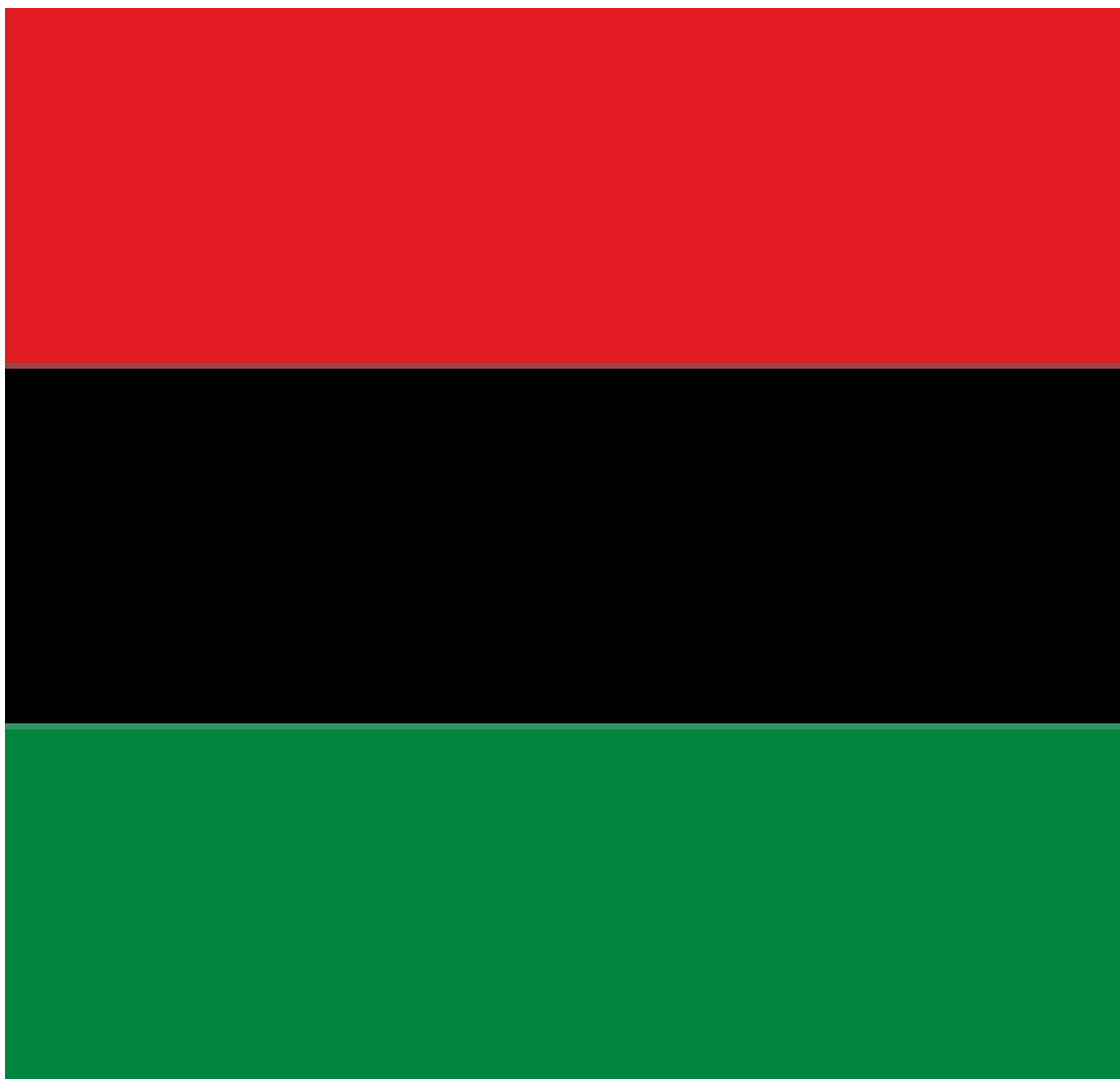
Figura 1 - Bandeira do movimento pan-africano 1 criada em 1920