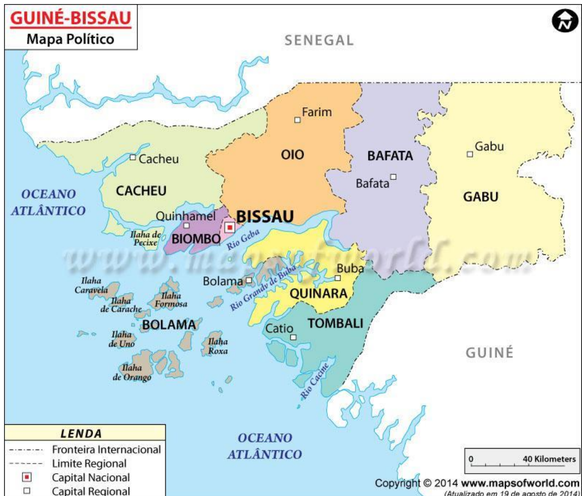
Figura 4 - Mapa da Guiné-Bissau