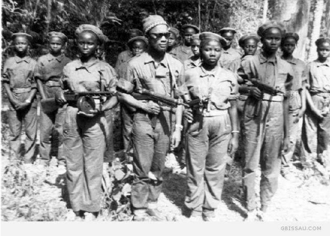
Figura 7 - Cabral nas matas de Guiné-Bissau (zonas libertadas) com as mulheres combatentes de liberdade da pátria do seu partido PAIGC