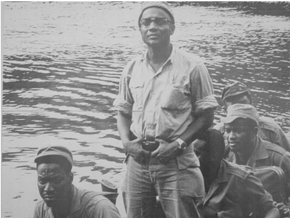
Figura 6 - Amílcar Lopes Cabral e guerrilheiros do PAIGC no rio da Guiné zonas libertadas