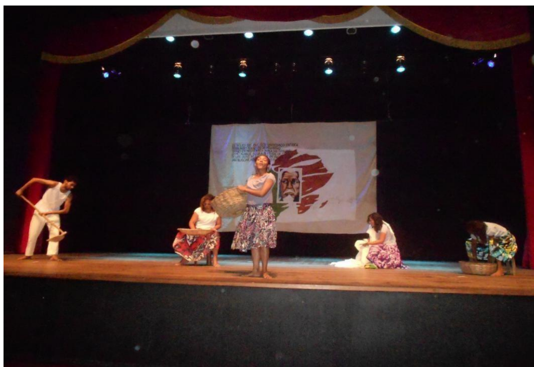
Figura 12 - Projeto alma africana IV