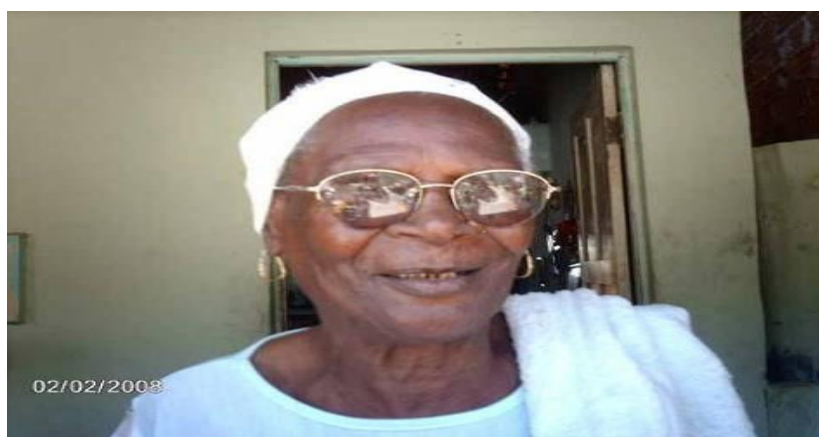
Figura 8 – Dona Caçula

Fonte: Santo (2008 apud TELES, 2012, p. 67)