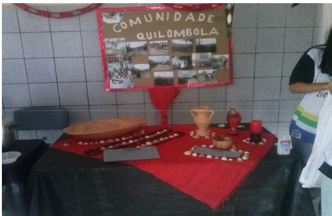
Figura 16 – Apresentação do projeto alma africana III