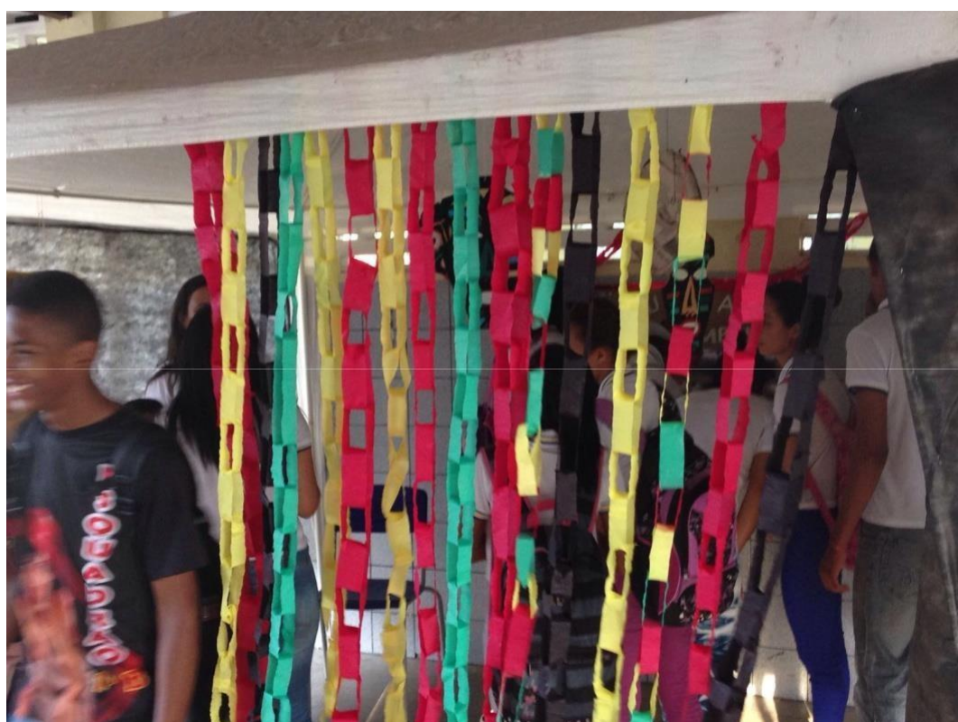
Figura 15 – Apresentação do projeto alma africana II