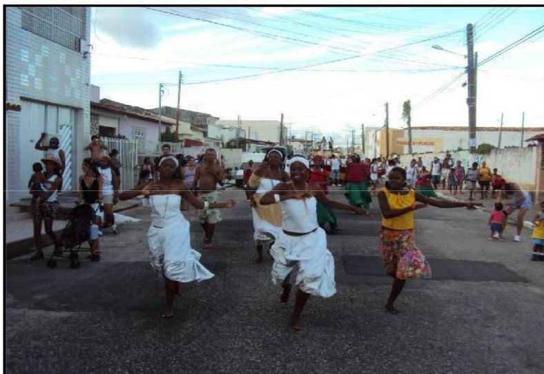
Figura 6 – Balé AFRO-CRILIBER

Fonte: Santo (2010 apud TELES, 2011, p. 83).