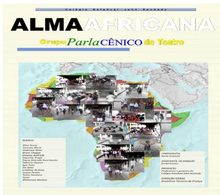
Figura 1 – Banner do Projeto Alma Africana