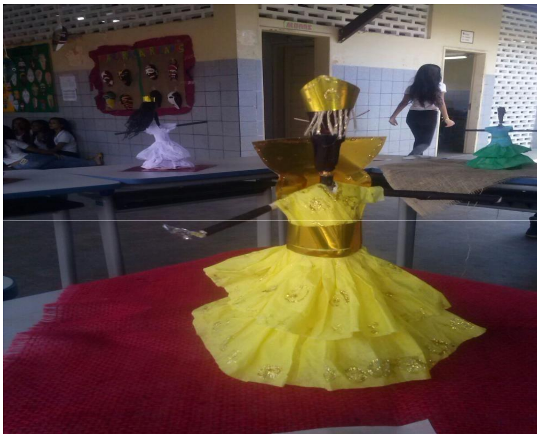
Figura 17 – Apresentação do projeto alma africana IV