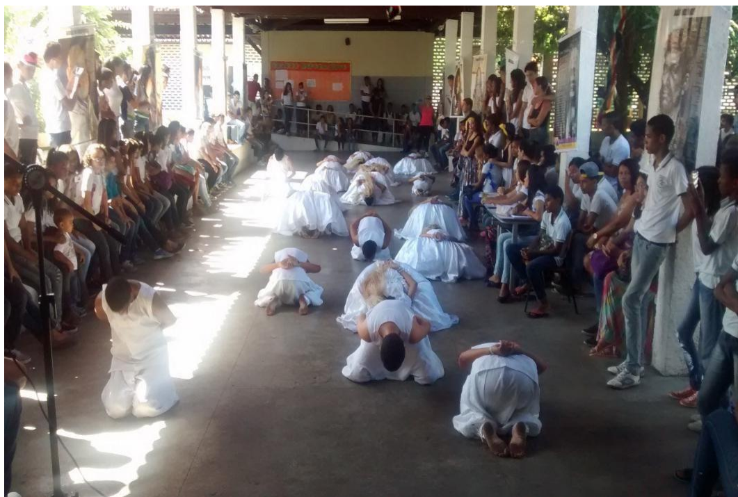
Figura 14 – Apresentação do projeto alma africana