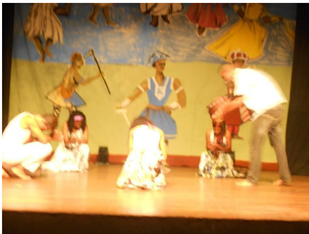
Figura 11 – Projeto alma africana III