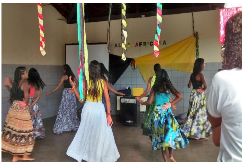
Figura 3 – Alunos Desenvolvendo o projeto Alma África no Colégio John Kennedy