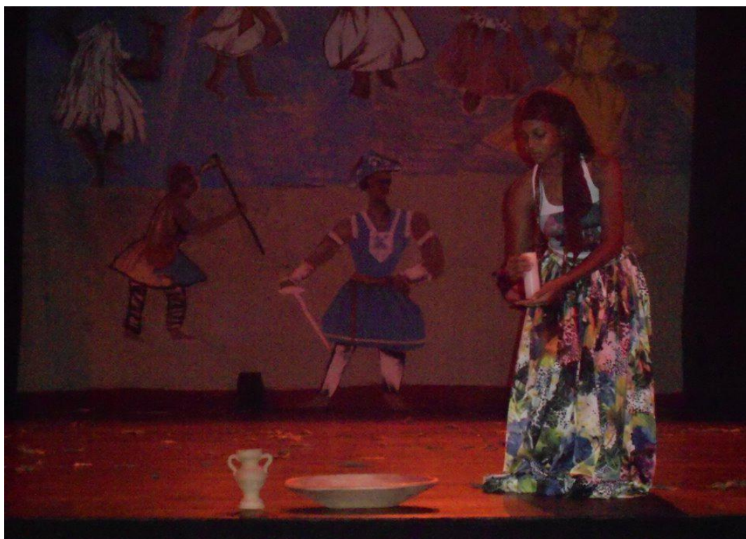
Figura 9 – Projeto alma africana