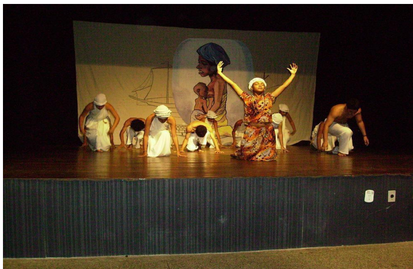
Figura 4 – Apresentação do grupo Teatral