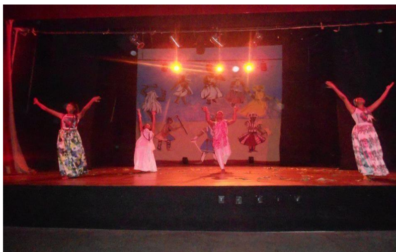
Figura 2 – Grupo ParlaCênico de Teatro