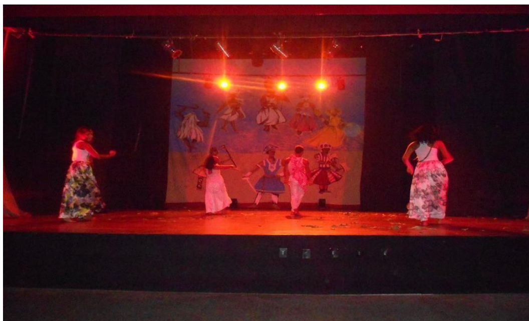
Figura 10 – projeto alma africana II